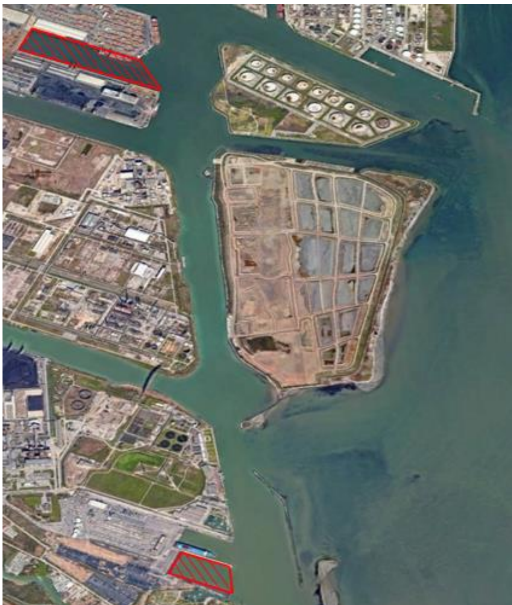
Figura 2 – specchi acquei interdetti alla navigazione, indicati in rosso