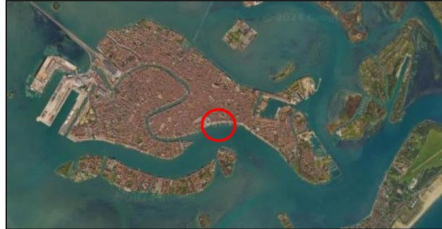
Figura 1 – Inquadramento geografico